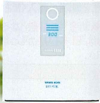
連続生成型電解水素水整水器